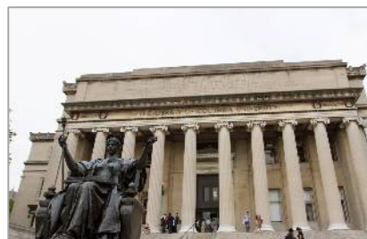
「マナバ」を採用した コロンビア大学

また、現在当社が日米をはじめとしたグローバル市場で積極的に展開しているクラウド型の教育支援システム「マナバ」についても大きく取り上げられ、自社で開発・販売をする「マナバ」が、コロンビア大学などの米国の名門大学6校で採用されたことが紹介されました。