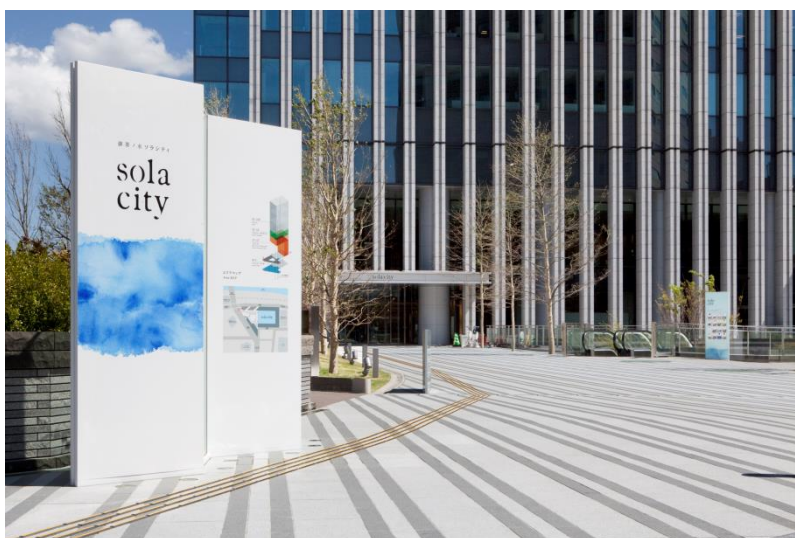
御茶ノ水ソラシティカンファレンスセンターにて、10月25日（水）より開催

「eラーニングアワード 2017 フォーラム」は 御茶ノ水ソラシティカンファレンスセンターにて開催。学校法人や、教育・IT 関係会社 約 1 万名の来場者を見込んでいます。