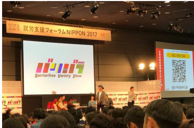
フォーラム参加者は自身の携帯電話で respon のアンケートに回答しました

会場全体の意見が瞬時に集計・共有されることで、ライブ感あふれる参加型のイベントが実現しました。番組の放送は1月14日（日）夜7時、再放送は19日（金）0時（木曜深夜）の予定です。